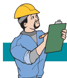
Tabella 1 – Definizioni riportate nell'art. 2, comma 1 del D.Lgs. 81/2008