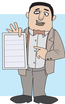
Tabella 2 – RLS: Quanti e dove? (D.Lgs. 81/2008 art. 47 comma 7)